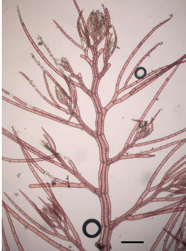
Figur 3. Skotttopp av japanplym. Polysifon huvudaxel med sidogrenar och monosifona pseudolateraler. Skälstreck: 0,2 mm. Shoot tip of Heterosiphonia japonica . Polysiphonal main axis with side branches and monosiphonal pseudolaterals. Scale: 0.2 mm.

För andra arter har nyetableringarna varit mera iögonfallande som i fallet med havsperuken Gracilaria vermiculophylla , som dök upp i Göteborgs södra skärgård så sent som år 2003 där den växer på grunt vatten, lokalt i stora mängder kring ålgräsängar Zostera marina . Ett tidigare exempel är Dasya baillouviana från