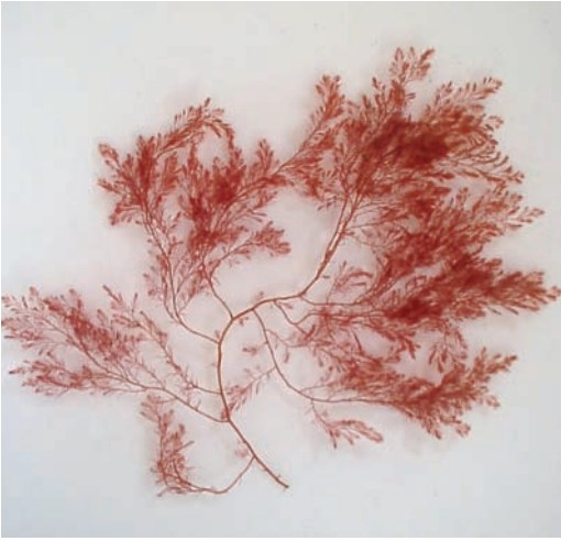
Figur 2. Japanplym är en 5–10 cm hög, mörkröd rödalg. Heterosiphonia japonica .

trafik som går mellan den norska oljeindustrin och oljemarknaden i Nederländerna (Lein 1999).