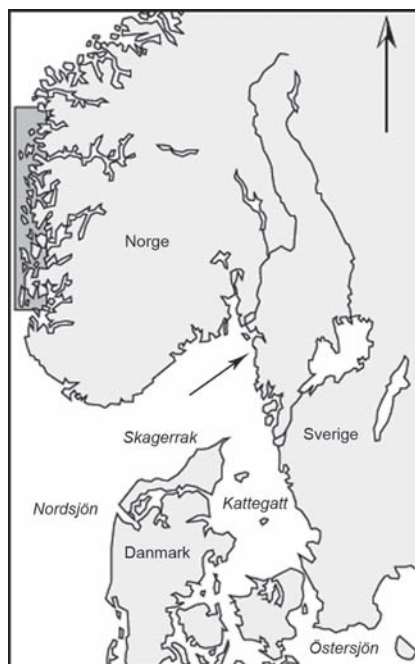
Figur 1. Japanplym hittades i Kosterfjorden (vid pilen). Algens utbredning vid norska västkusten enligt Lein m.fl. (1999) indikeras med ett grått fält. Heterosiphonia japonica was found in Kosterfjorden at the Swedish west coast (arrow). Its present Norwegian distribution is indicated in grey.

I slutet av oktober 2003 skrapade vi med bergsskrapa på flera lokaler i Kosterarkipelagen. Vid genomgång av det insamlade materialet väster om lokalen Eleven (27 okt. 2003, 58° 53' N, 10° 59' Ö, djup 4,5–7 meter) fann vi ett fåtal exemplar av en för området tidigare okänd, fingrenad, rödalg. Två dagar senare fann vi vid Medskär (5,6 m grund syd Medskär, 58° 52' N, 11° 04' Ö, djup 7–13,5 meter) ytterligare material, denna gång i riklig mängd. Fyndlokalerna som båda är vågskyddade men strömmande är belägna ungefär 5 km från varandra, på var sin sida av Kosterarkipelagen. En stor del av exemplaren hängde löst i skrapans nät, men individ har även påträffats på hästmussla och småsten,