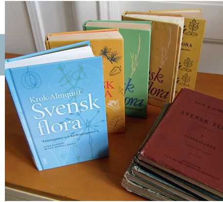
Krok-Almquist Svensk flora , 29 uppl.

Antagligen ligger samma tanke bakom de nya bilderna av Carex digitata och C. ornithopoda men där tycker jag att resultatet inte blev lika bra. Den gamla bilden liknade en vispstarr som den ser ut i naturen, men jag kan inte säga detsamma om den nya. Som kuriosa kan nämnas att den lilla dubbletten