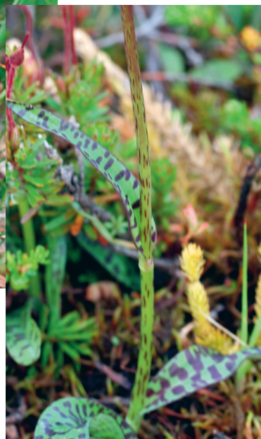
Figur 1. De tydliga fläckarna på blad och stjälk syntes på långt håll. – Torkilstöten 19 juli 2010 (vänster) & 9 juli 2009 (höger).

Paulsson, L.-E. 2010. Extra fläckigt nyckelblomster. [ Dactylorhiza maculata with spots also on the stem.] – Svensk Bot. Tidskr. 104: 356. Uppsala. ISSN 0039-646X.