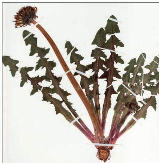
Figur 2. Nästan varje år upptäcks nya arter för landet. Denna art, glansmaskros T. nitidum , en nykomling i den svenska maskrosfloran, upptäcktes nära järnvägen utanför Åstorp i Skåne 2006.

Borealia ). De belägg från Sverige som tidigare getts namnet T. brachyceras har visat sig tillhöra arten T. simulum Brenner. Namnet rosettmaskros överförs i denna lista till T. simulum , så som den också benämndes av Hultén (1950).