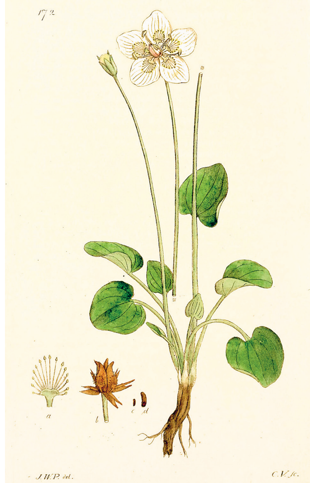
Slätterblomma Parnassia palustris .

I boken ”Utkast till svenska växternas naturhistoria” (1867–68) skriver C. F. Nyman om slätterblomman att ”enligt DYBECK begagna landflickorna kronbladens saft till ögonvatten, särdeles i Vermland, men icke endast såsom medel mot