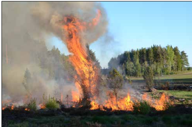
Naturvårdsbränningen i kraftledningsgatan vid Vissboda.

Vid Vissbodamon i Hallsbergs kommun genomförde länsstyrelsen i maj en naturvårdsbränning på 1,5 hektar för att gynna mosippa och mellanlummer. Arbetet finansierades av länsstyrelsen och Svenska Kraftnät. Bränningen utfördes i delar av Vissbodamons naturreservat och i en angränsande kraftledningsgata i samband med att ledningen var nertagen då nya stolpar och ny ledning skulle sättas upp. Båda arterna gynnas av bränning och markstörning.