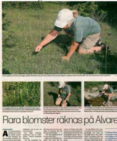
Artikel om floraväktarverksamheten på Öland, i en öländsk dagstidning.

Artiklar och rapporter som publicerats rörande floraväktari och rödlistade arter under 2015, se bilaga 1.