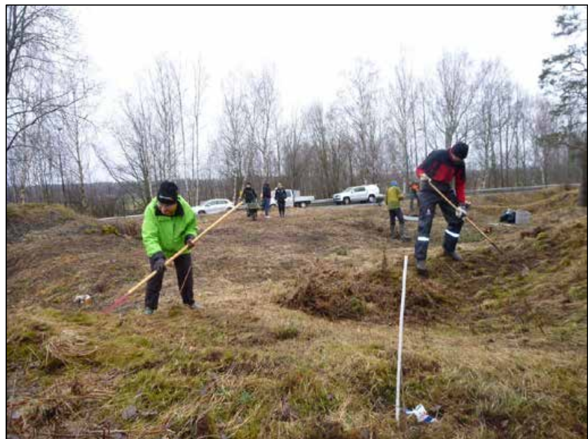
Floraväktare och personal från Länsstyrelsen vid städningen av backsippelokalerna Blacksta naturminne i Kumla kommun.

Antalet backsippor har under senare år legat på cirka 60 blomstänglar, men efter de omfattande åtgärderna inför årets växtsäsong räknades det in drygt 100 blomstänglar. Det ska bli spännande att följa den fortsatta utvecklingen av backsippan på lokalen efter restaureringsinsatsen och den återupptagna hävden.