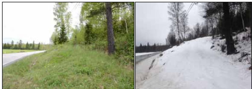
Den gamla brukningsvägen vid Skrekarhyttan före och efter åtgärd, med bl a stubbdaggkåpa.