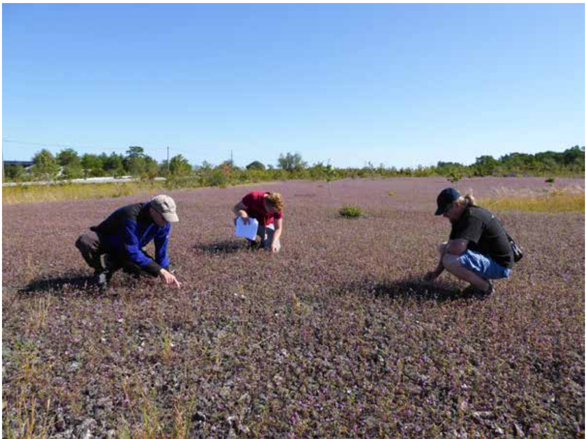
Floraväktarna på årets läger på Gotland funderar över hur de ska räkna kalkdån på lokalen

Floraväktarna är ett nätverk av naturintresserade människor runt om i landet som bevakar och ökar kunskapen om våra hotade växter. Svenska Botaniska Föreningen ansvarar för samordningen av verksamheten. Alla som är intresserade av växter kan bli floraväktare.