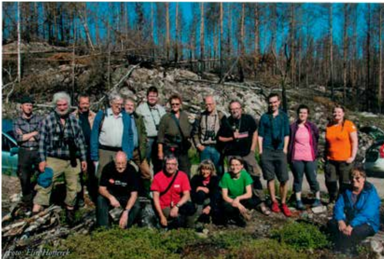
Gänget som eftersökte svedjenäva i Västmanland

mer än ett år för att floraväktarna ska hinna besöka lokalerna. År 2014 var det dessa arter slättergubbe (VU) – 721, ryl (EN) – 445 och röd skogslilja (VU) – 73 rapporter är inrapporterade på Artportalen 2015. År 2015 var det slätterfibbla (VU) – 932, vit kattost (VU) – 175 och myrstarr (EN) – 23. Närmare 2000 lokaler har besökts för nära hotade arter.