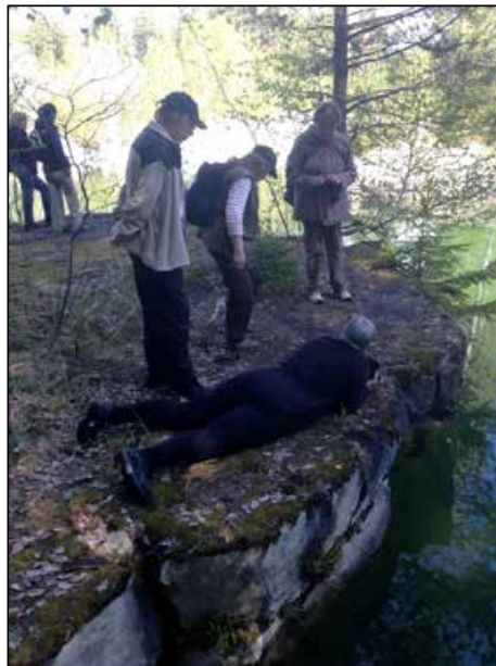
Närstudie av hällebräcka vid Tåsta naturreservat.