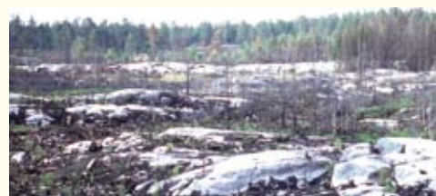
Brandfält i Svalehult 1995.