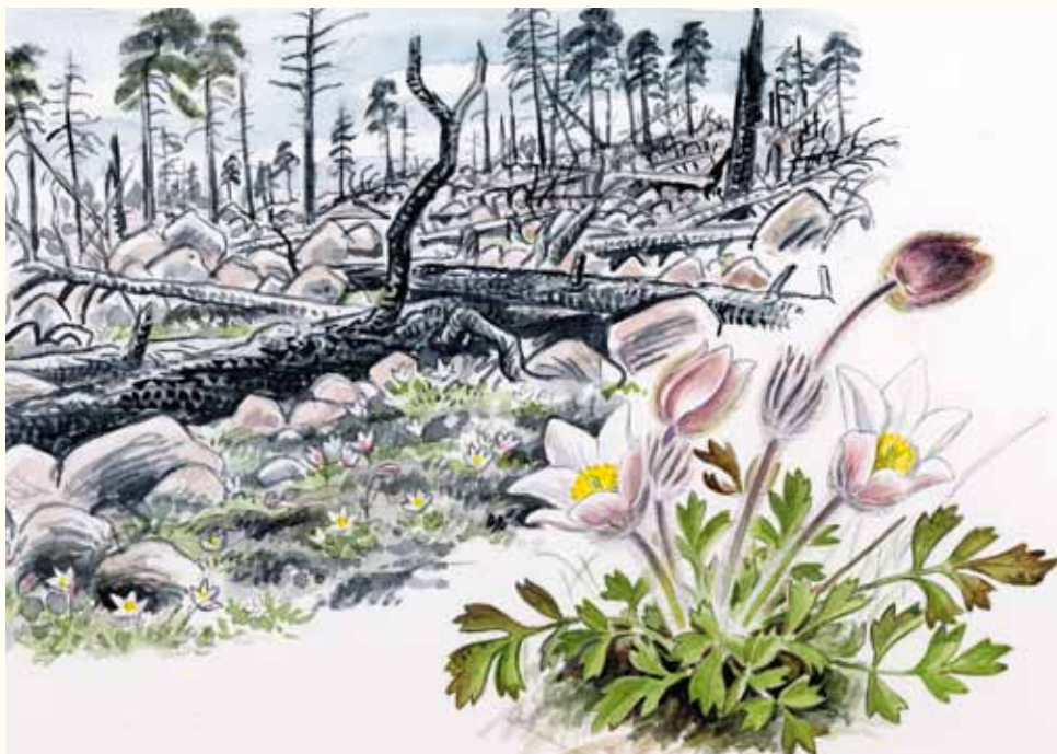
Illustration: Nils Forshed