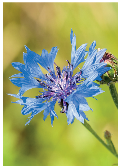
Blåklint Centaurea cyanus var Årets växt 2013.

Till sist ett varmt tack till alla som bidragit med rapporter av blåklint under fjolåret. I år är du särskilt välkommen att rapportera dina fynd av slätterblomma, som är Årets växt 2014. SBT .