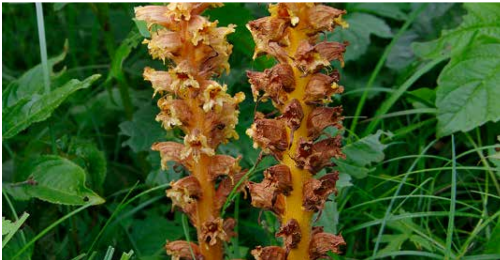
Den märkliga, klorofyllösa berberissnyltroten Orobanche lucorum parasiterar på berberis Berberis vulgaris . Arten har kommit till Sverige med människans hjälp. Sitt naturliga utbredningsområde har den i östra Alperna där den är endemisk.

Slättermarken fortsätter ner i slutningen nordväst om landsvägen. Denna del har en annan karaktär än det jag beskrivit ovan. Närmare vägen är det ett öppet område med