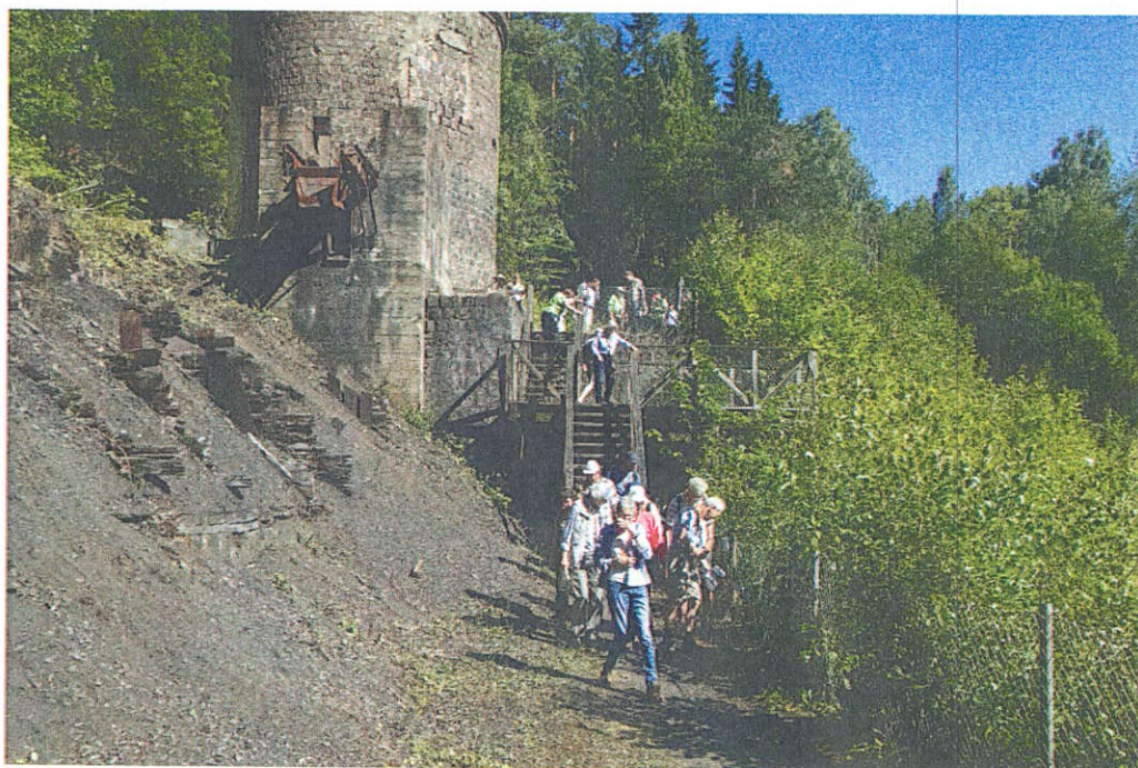
Botanikdagarna 2018 hölls i Västmanland. De kalkrika markerna i Klackbergs gamla gruvområde utanför Norberg erbjöd en spännande vandring och var både botaniskt och industrihistoriskt intressanta.

Svenska Botaniska Föreningen är en ideell rikstäckande förening för alla som är intresserade av våra vilda växter. Vi ger ut två tidskrifter och anordnar resor och kurser. Vi skyddar den svenska växtvärlden genom Floraväktarna och genom att agera i olika naturskyddsärenden.