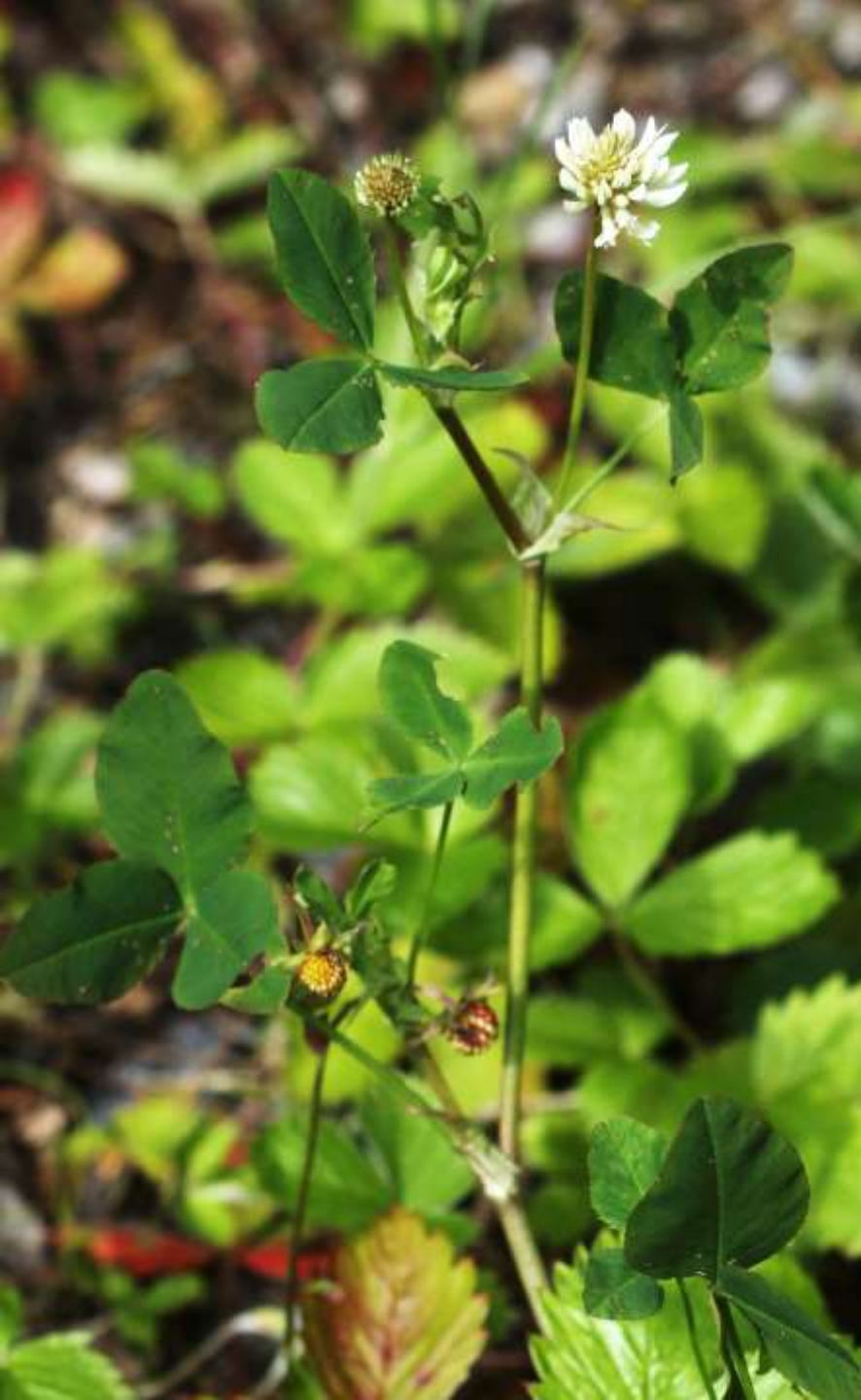
Alsike- klöver t.v.; skogs- klöver t.h.