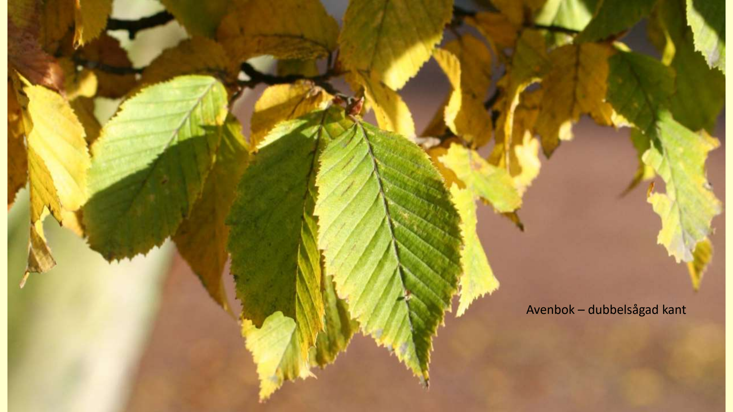
Avenbok – dubbelsågad kant