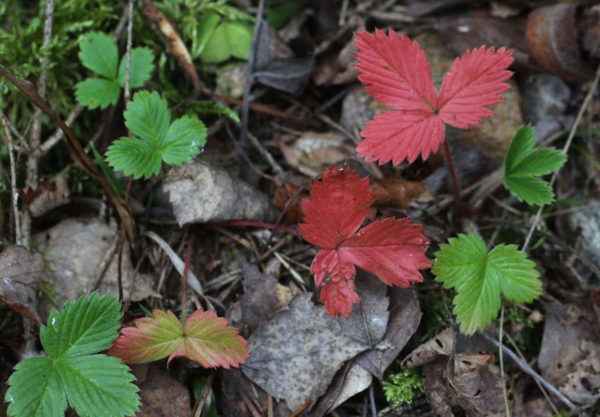
Smultron – också sågad kant