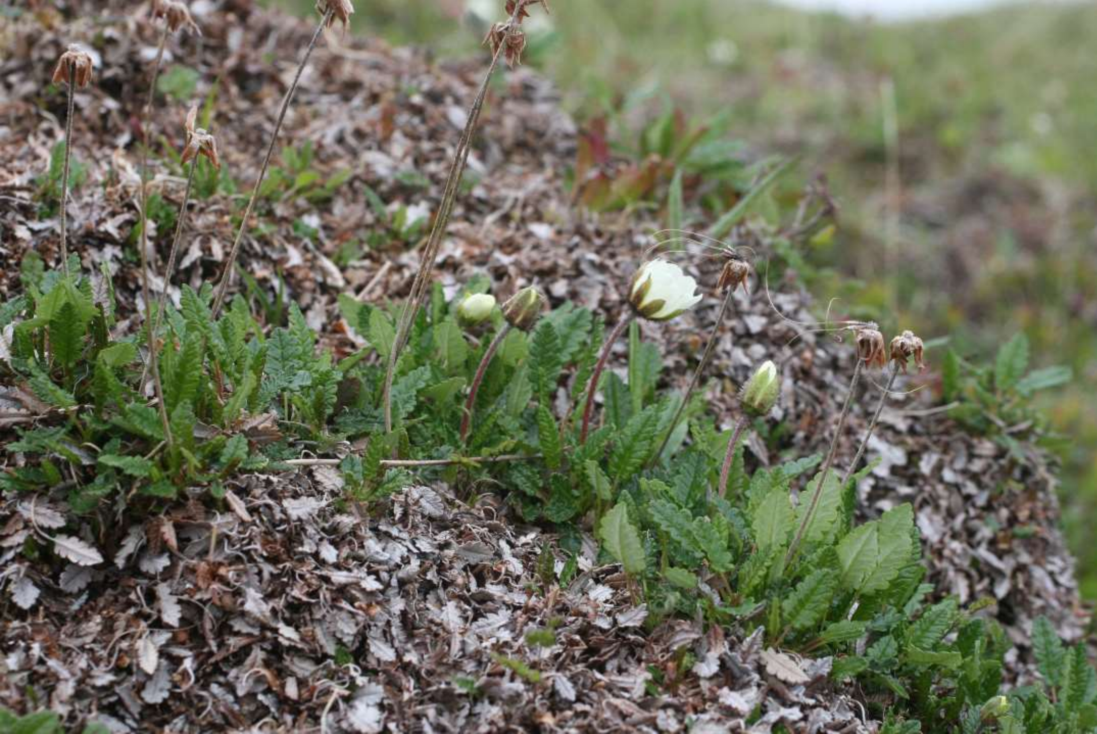
Fjällsippa – naggad kant