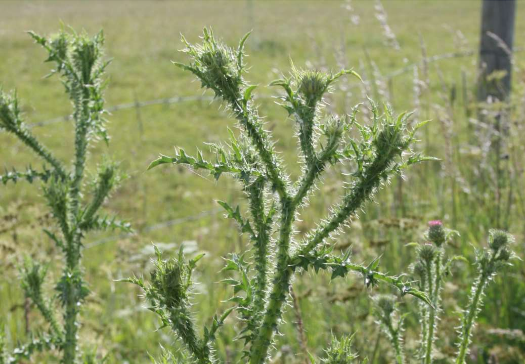
Piggtistel – dubbel- tandad