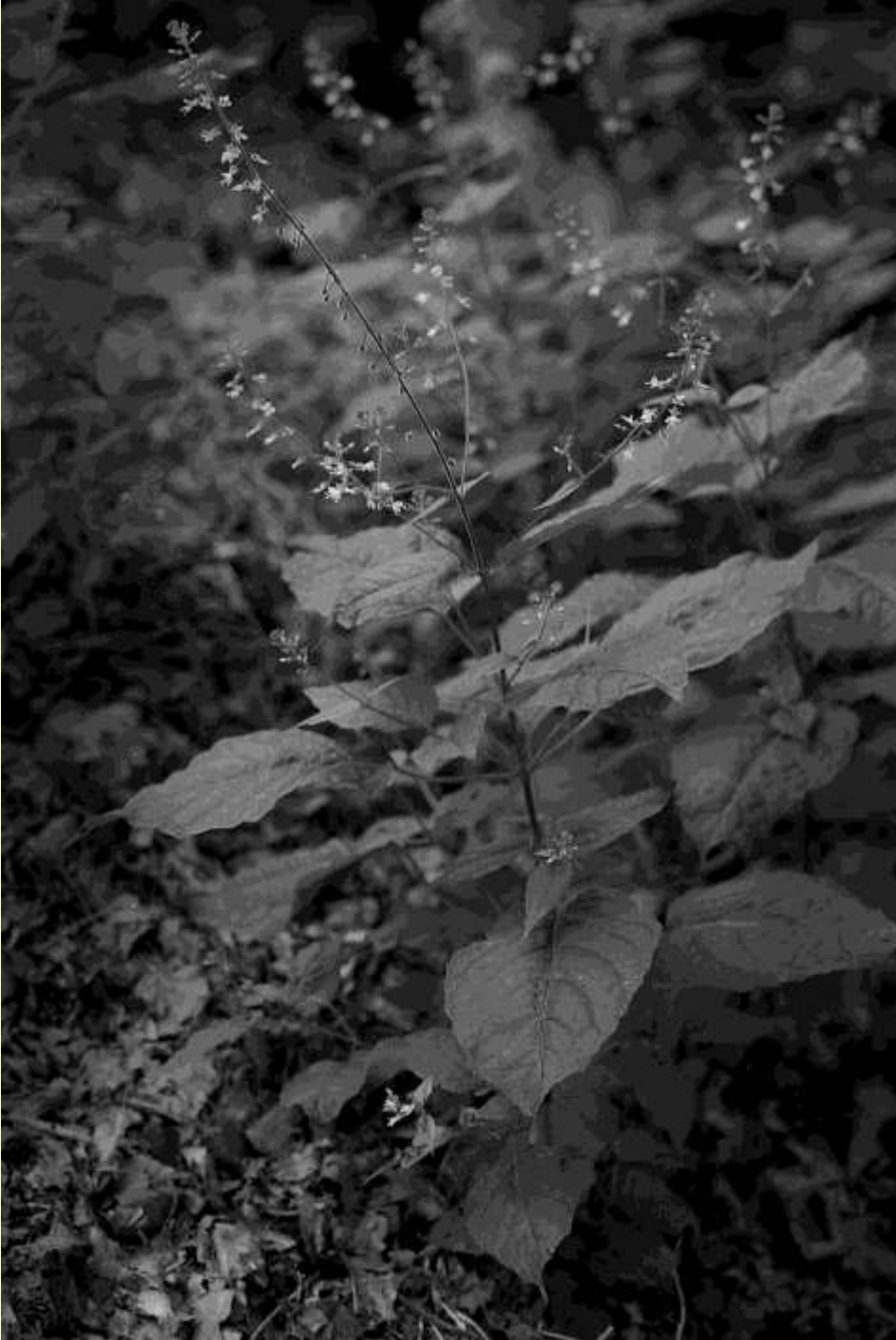
Stor häxört, C. lutetiana