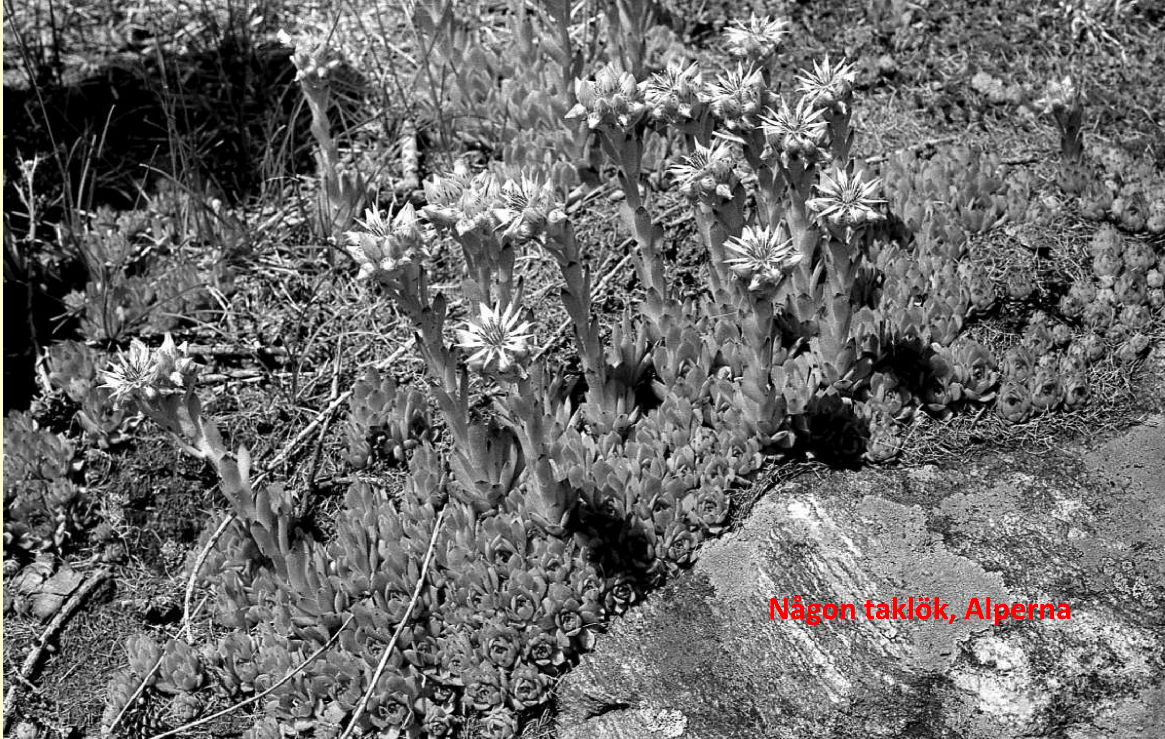
Någon taklök, Alperna