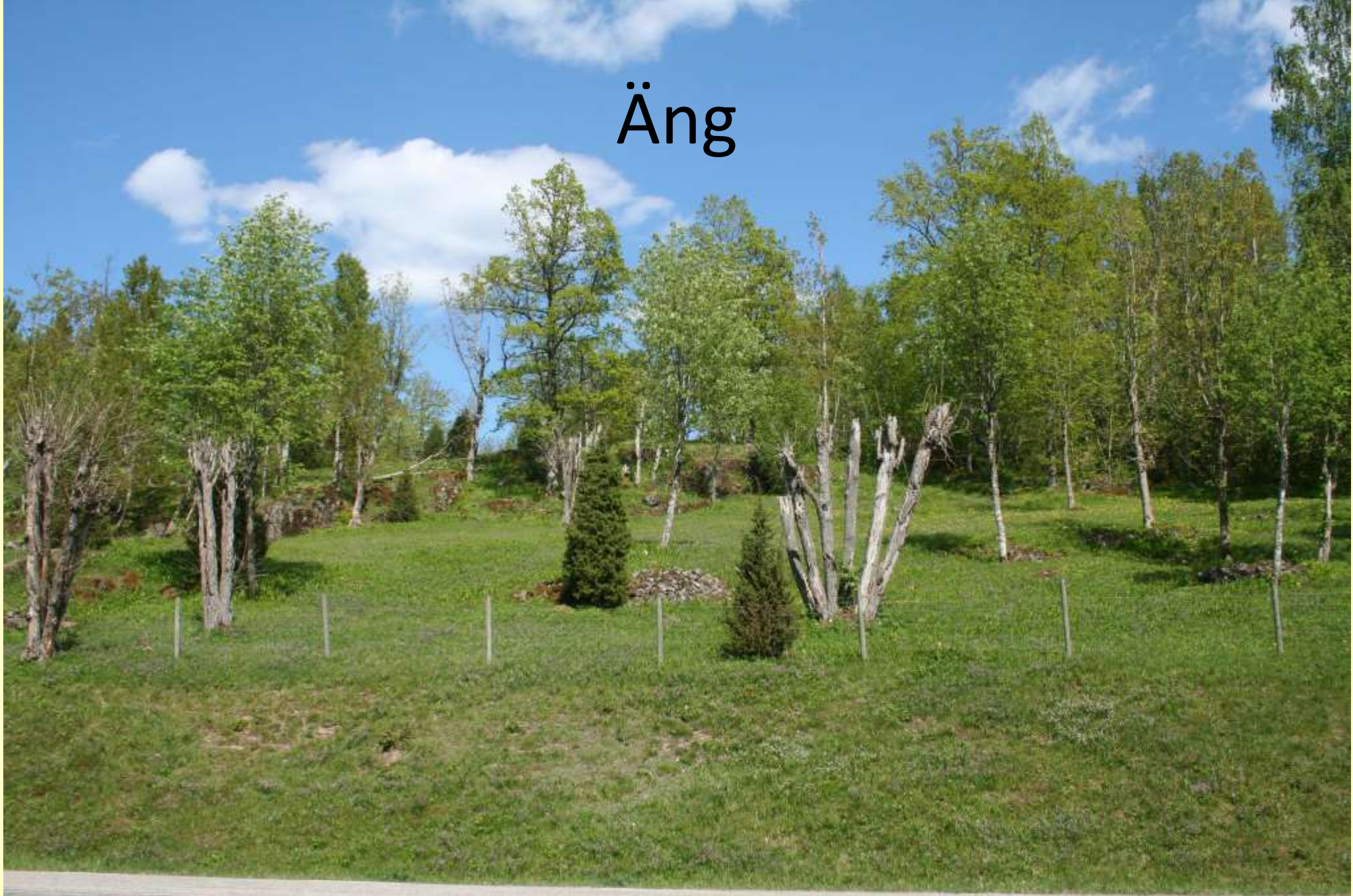
Bräcke Ängar, Åmåls kommun, Dalsland