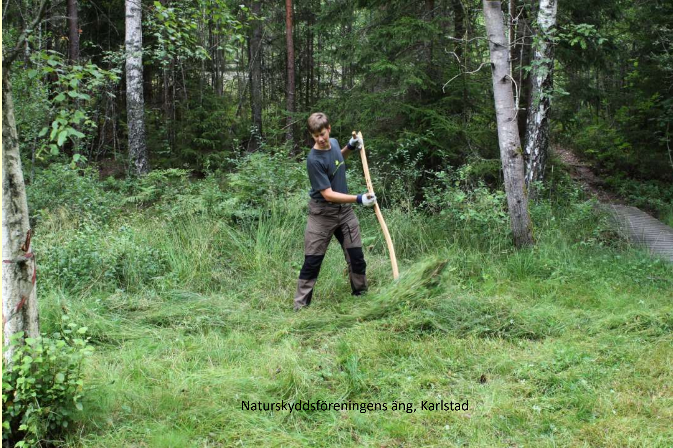
Naturskyddsföreningens äng, Karlstad