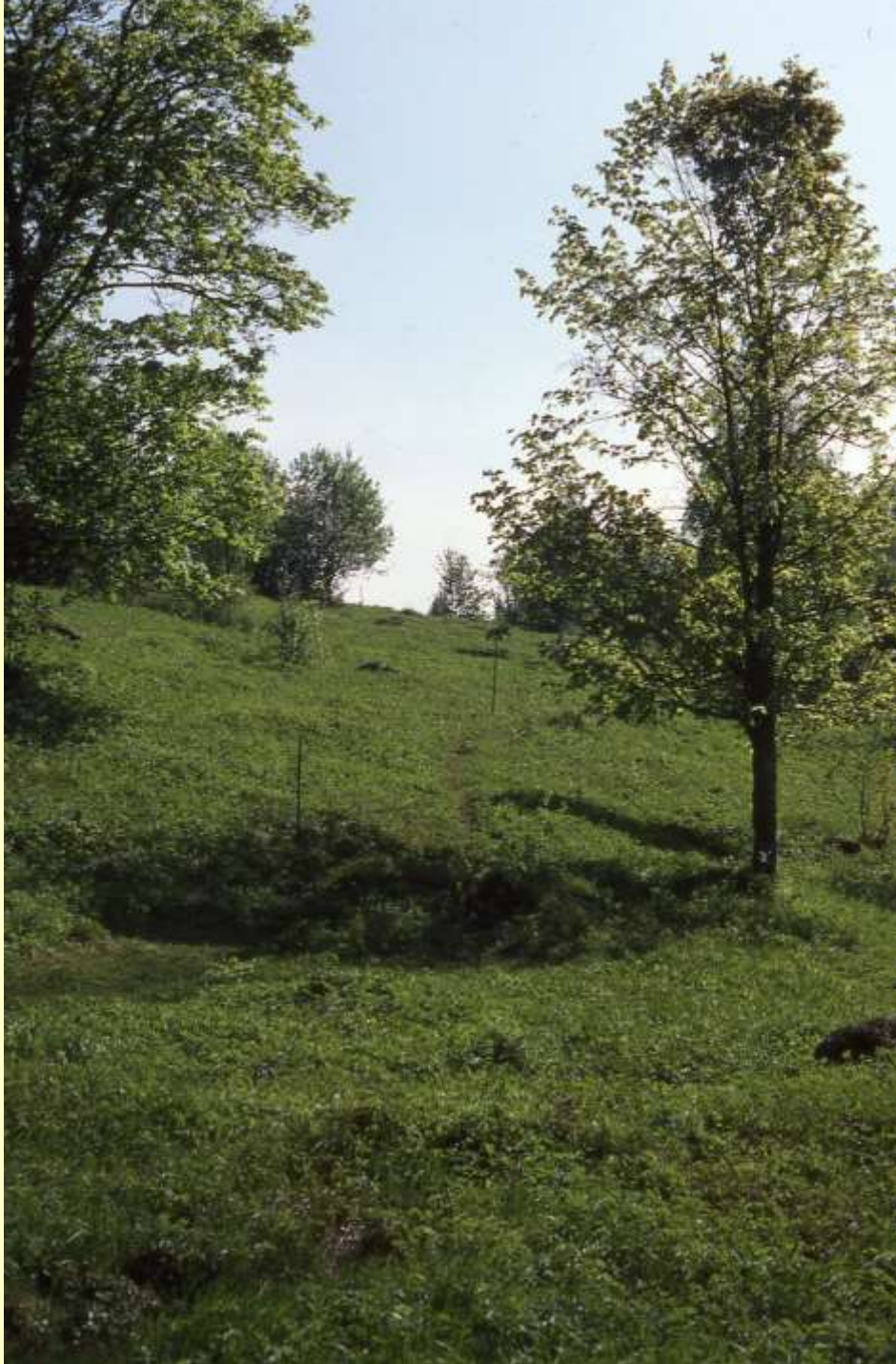
Kalvhöjden, Gräsmark, Sunne kommun, Värmland