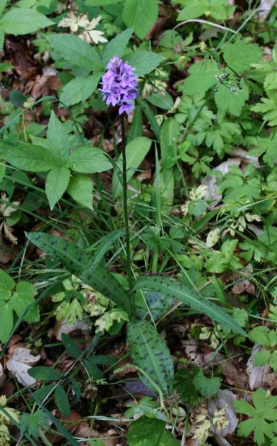
Skogsnycklar, D. maculata subsp. fuchsii