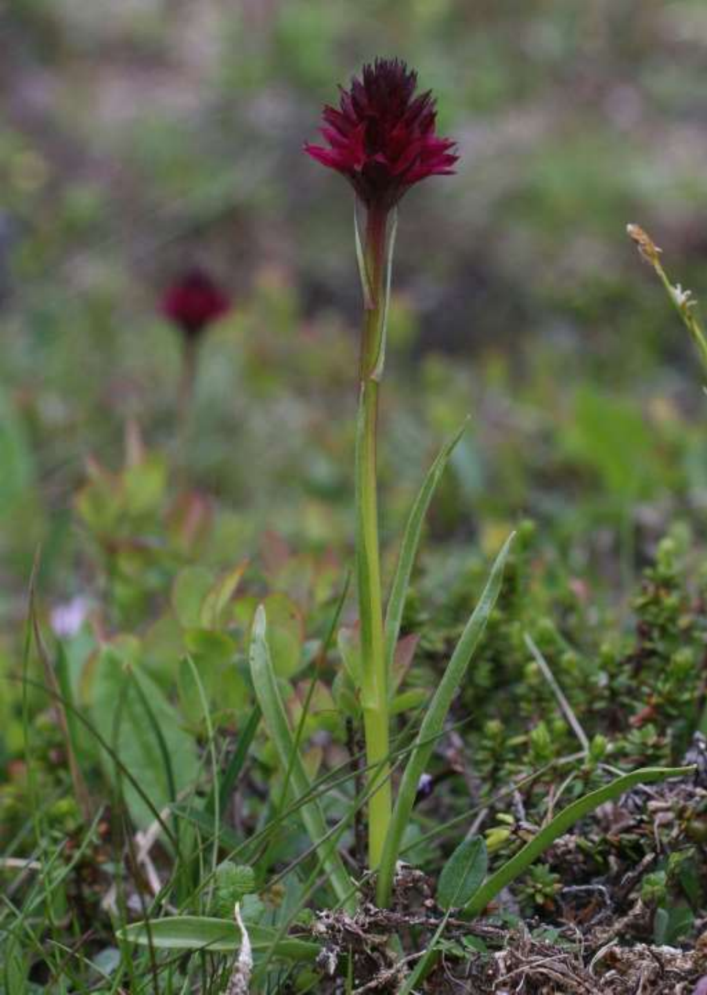
Brudkulla, G. runei