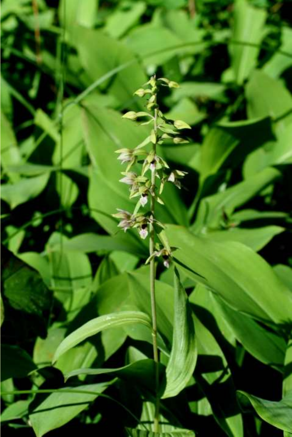
Skogsknipprot, E. helleborine