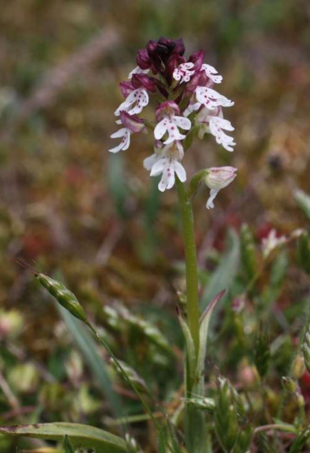
Krutbrännare, Neotinea ustulata