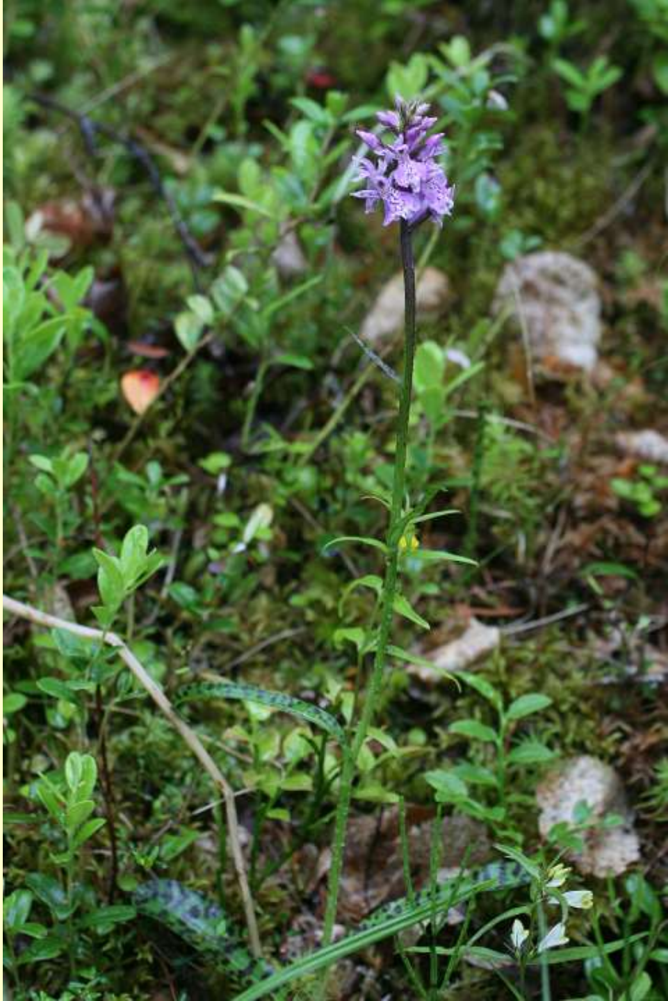
Fläcknycklar, Dactylorhiza maculata