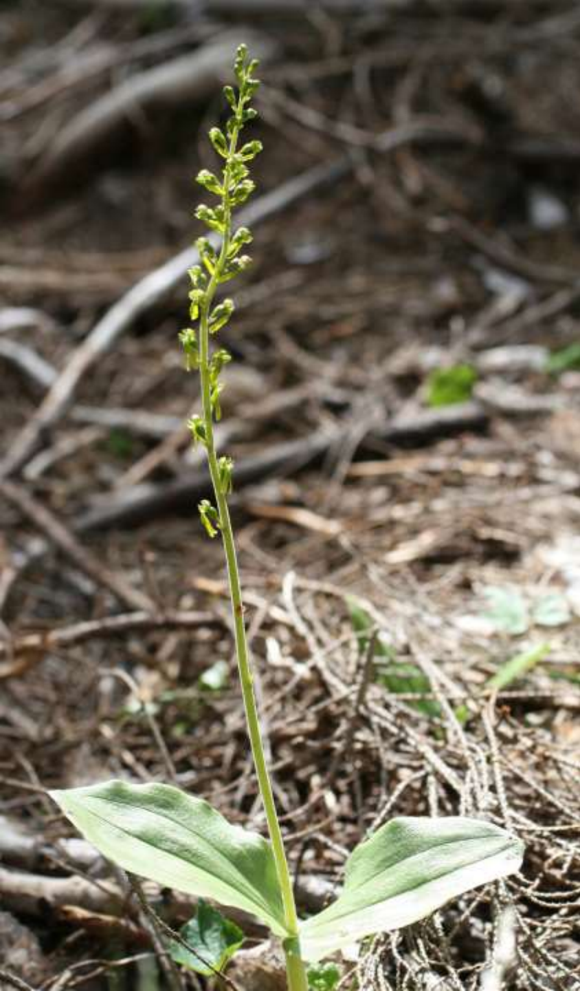
Tvåblad, Neottia ovata