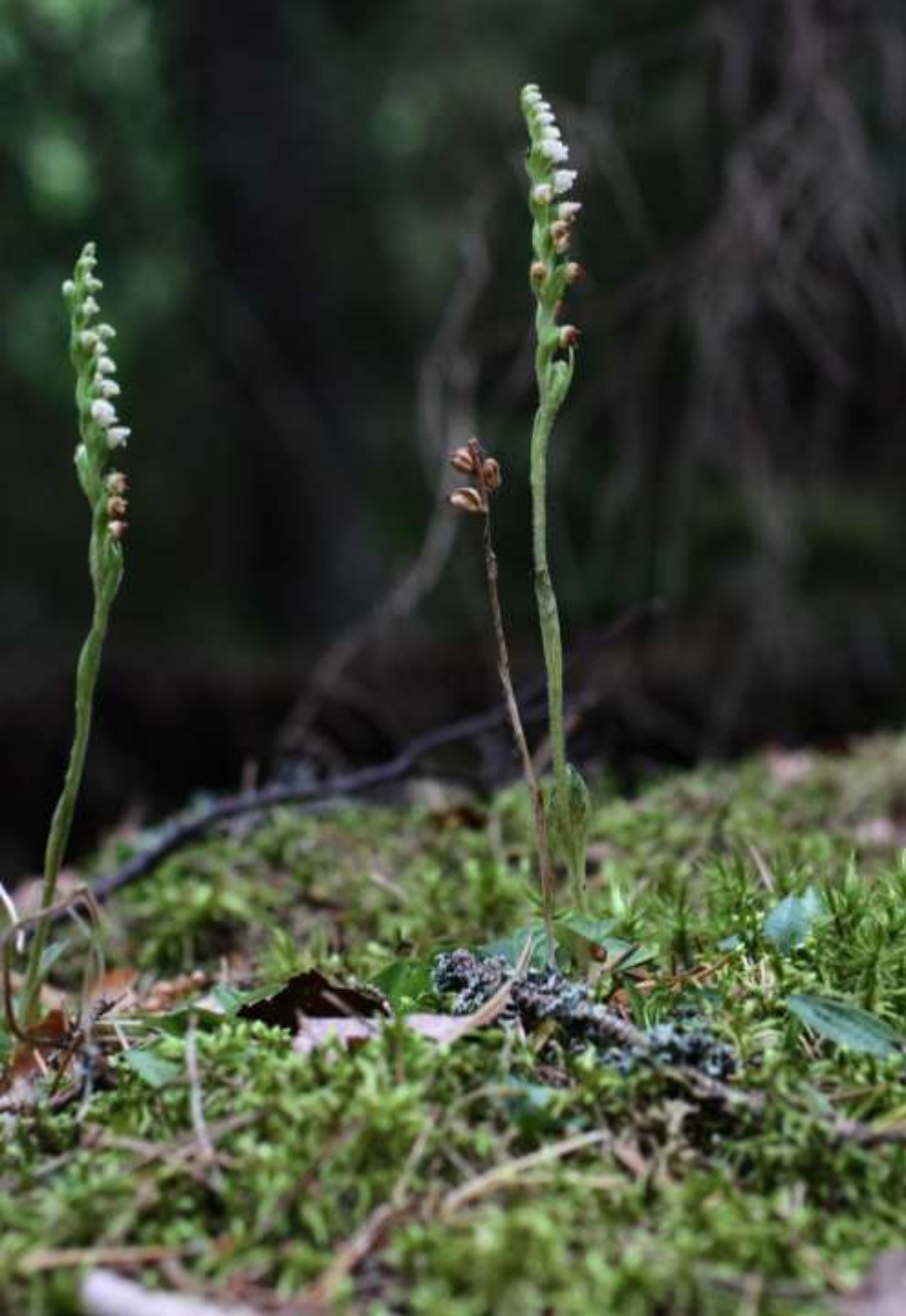
Knärot, Goodyera repens