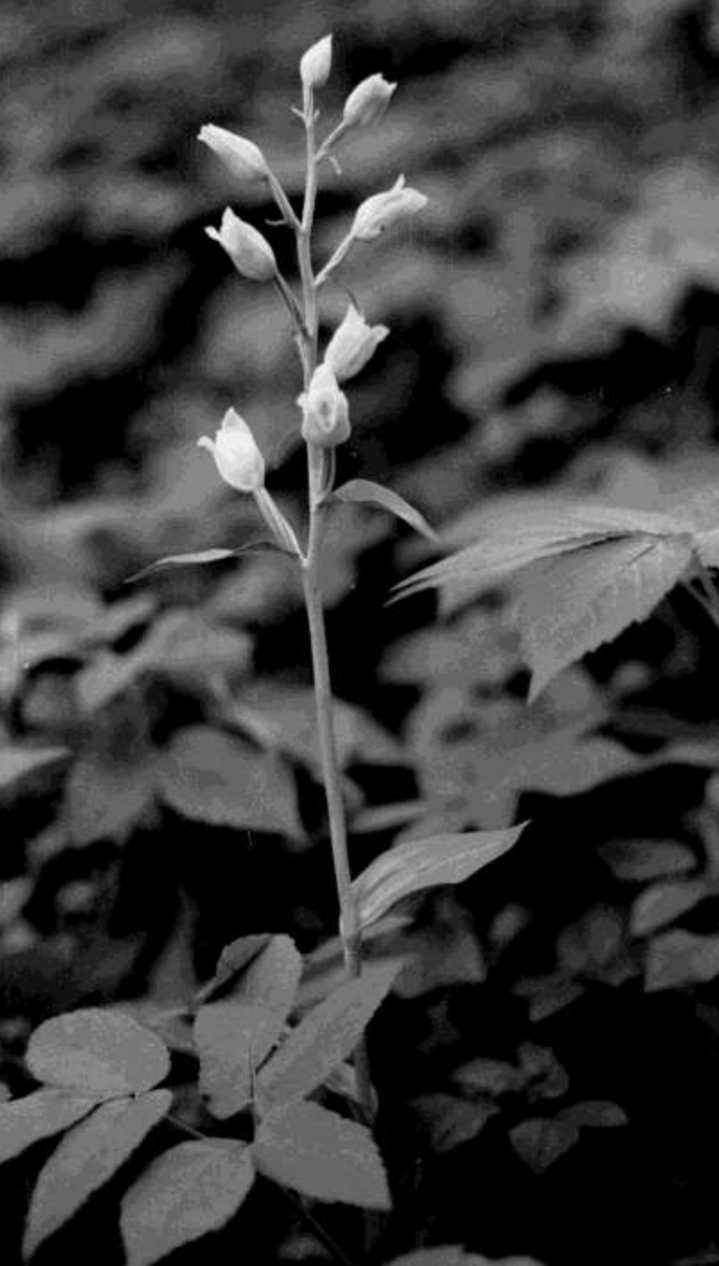
Stor skogslilja, storsyssla, Cephalanthera damasonium