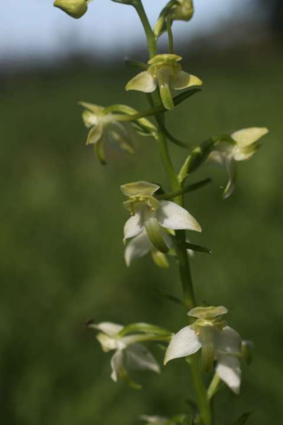
Grönvit nattviol, P. chlorantha