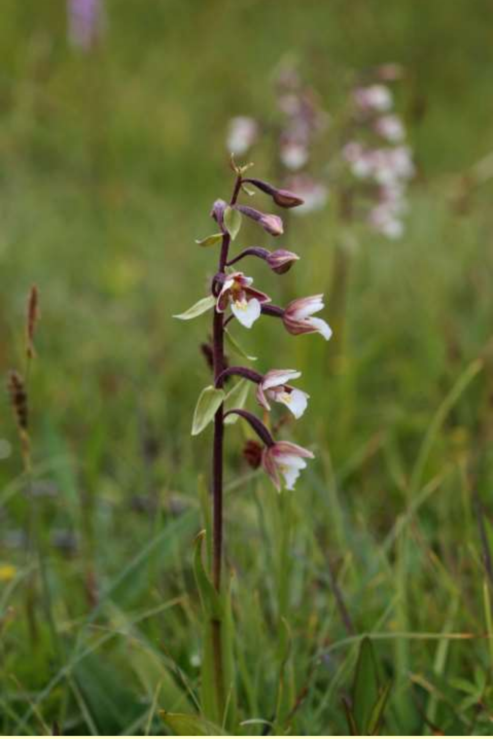
Kärrknipprot, E. palustris