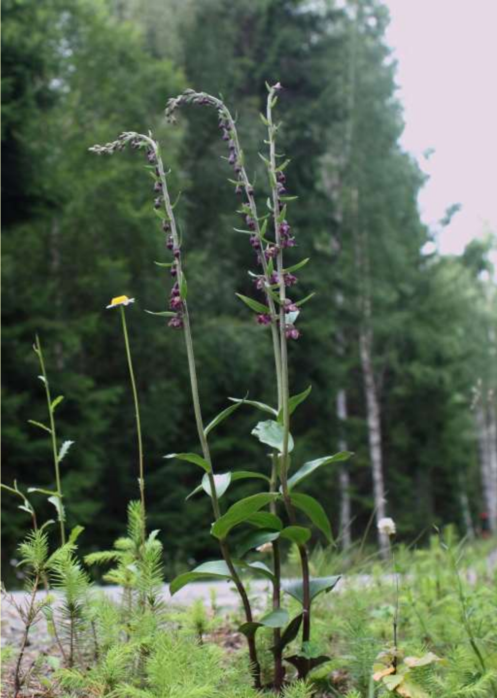
Purpurknipprot, Epipactis atrorubens