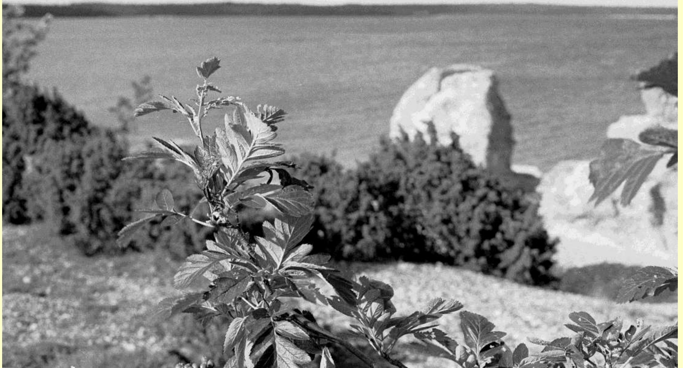
Troligen Finnoxel, Gotland