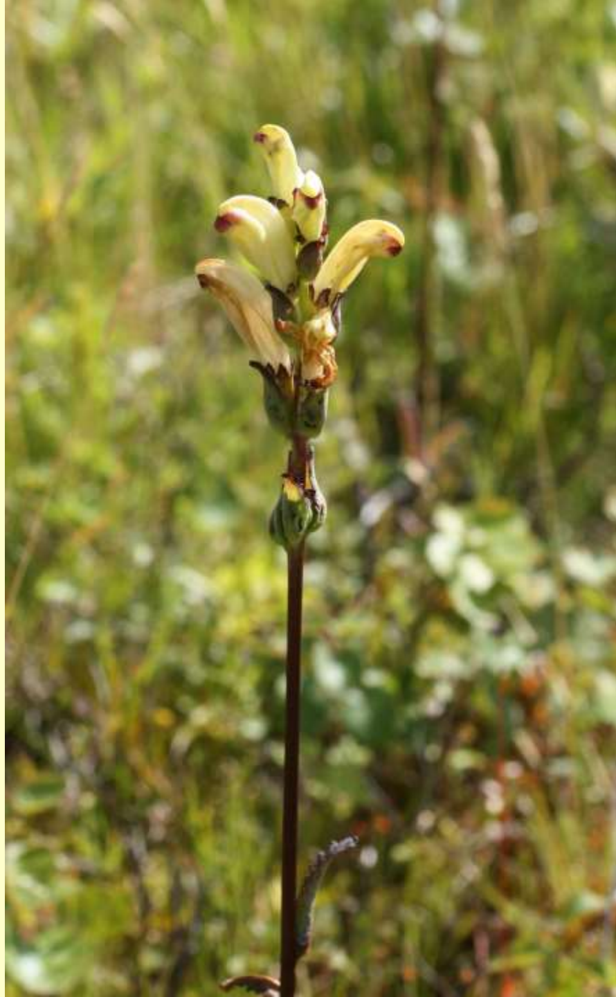
Kung Karls spira, P. specterum- carolinum