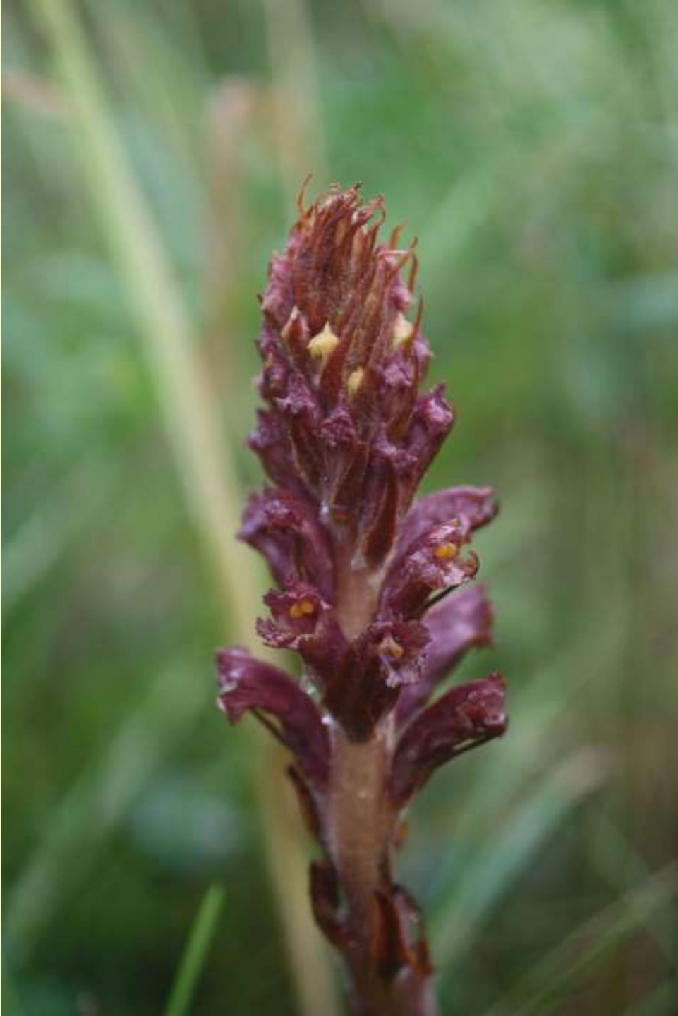
Klintsnyltrot, O. elatior