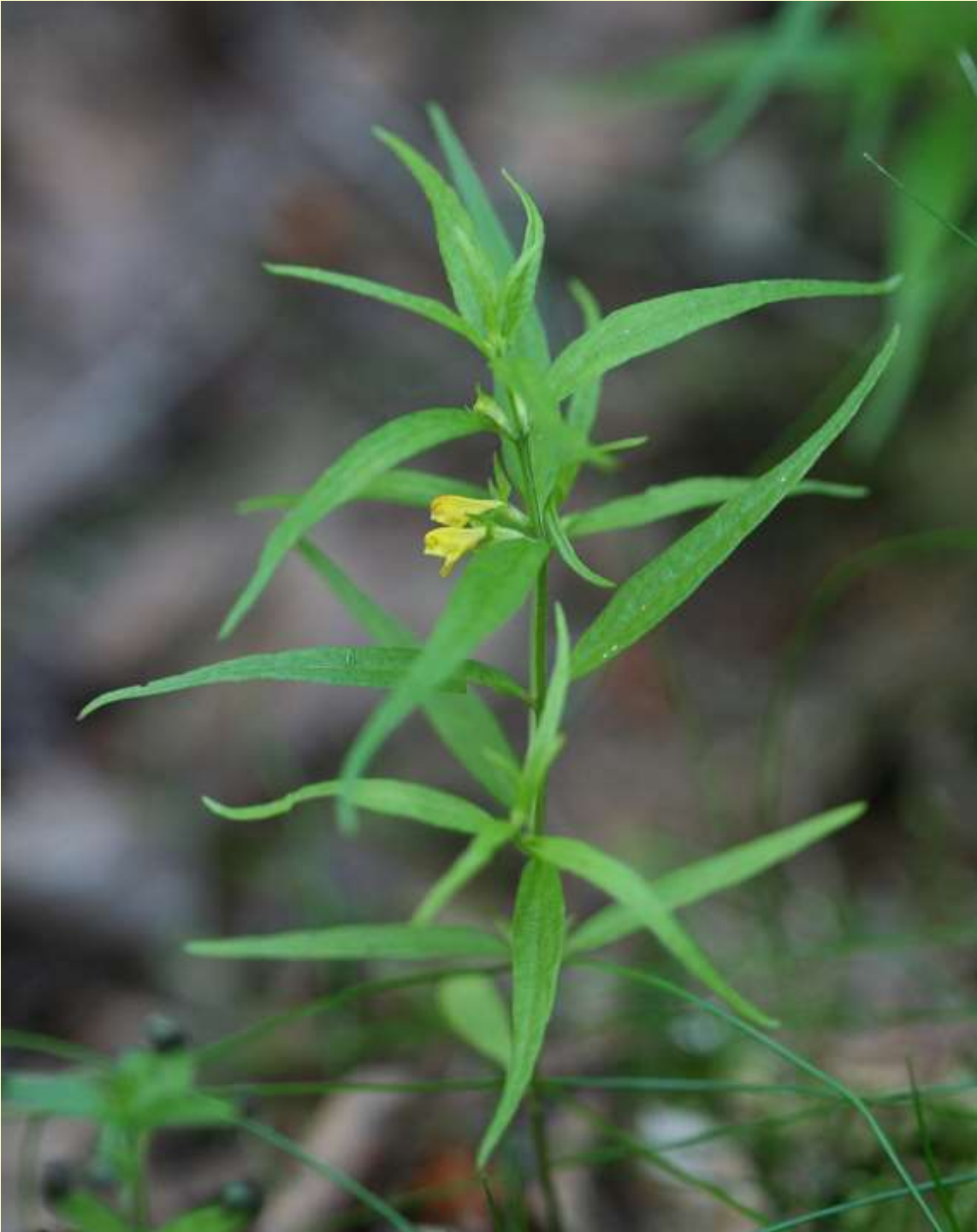
Skogskovall, M. sylvaticum