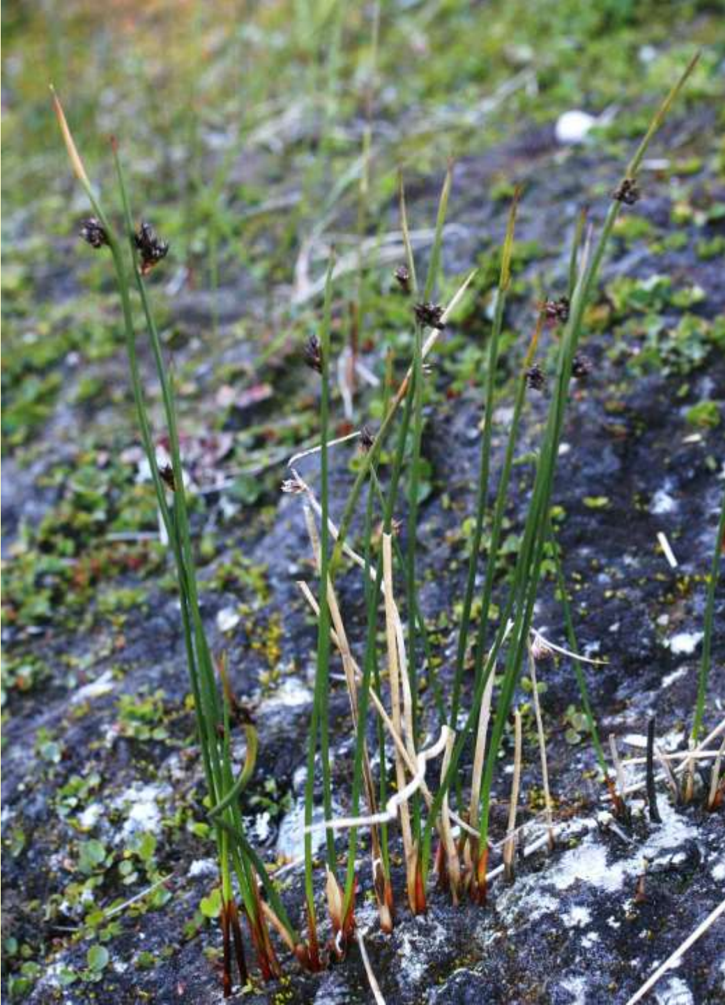
Fjälltåg, Juncus arcticus