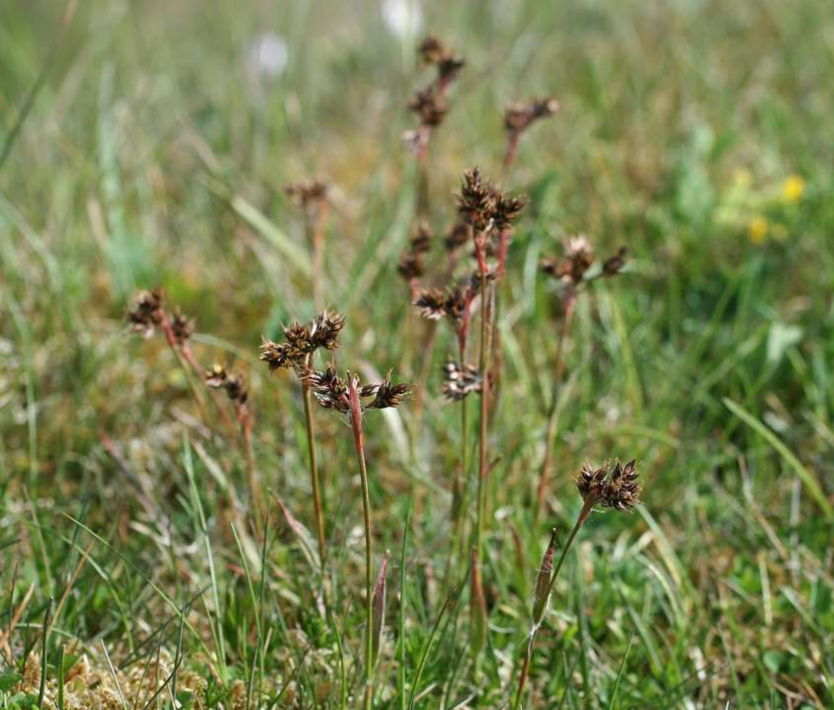
Knippfryle, Luzula campestris