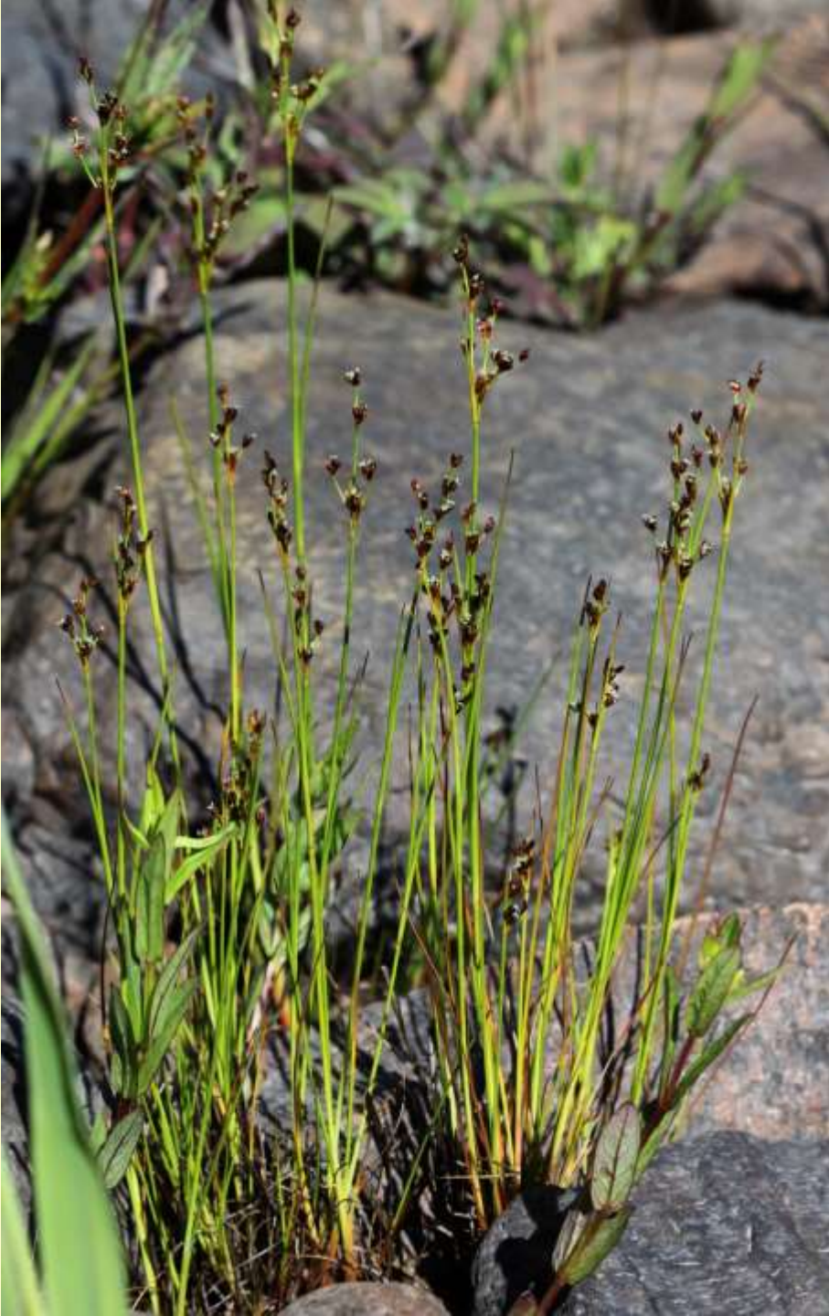
Myrtåg, Juncus alpinoarticulatus