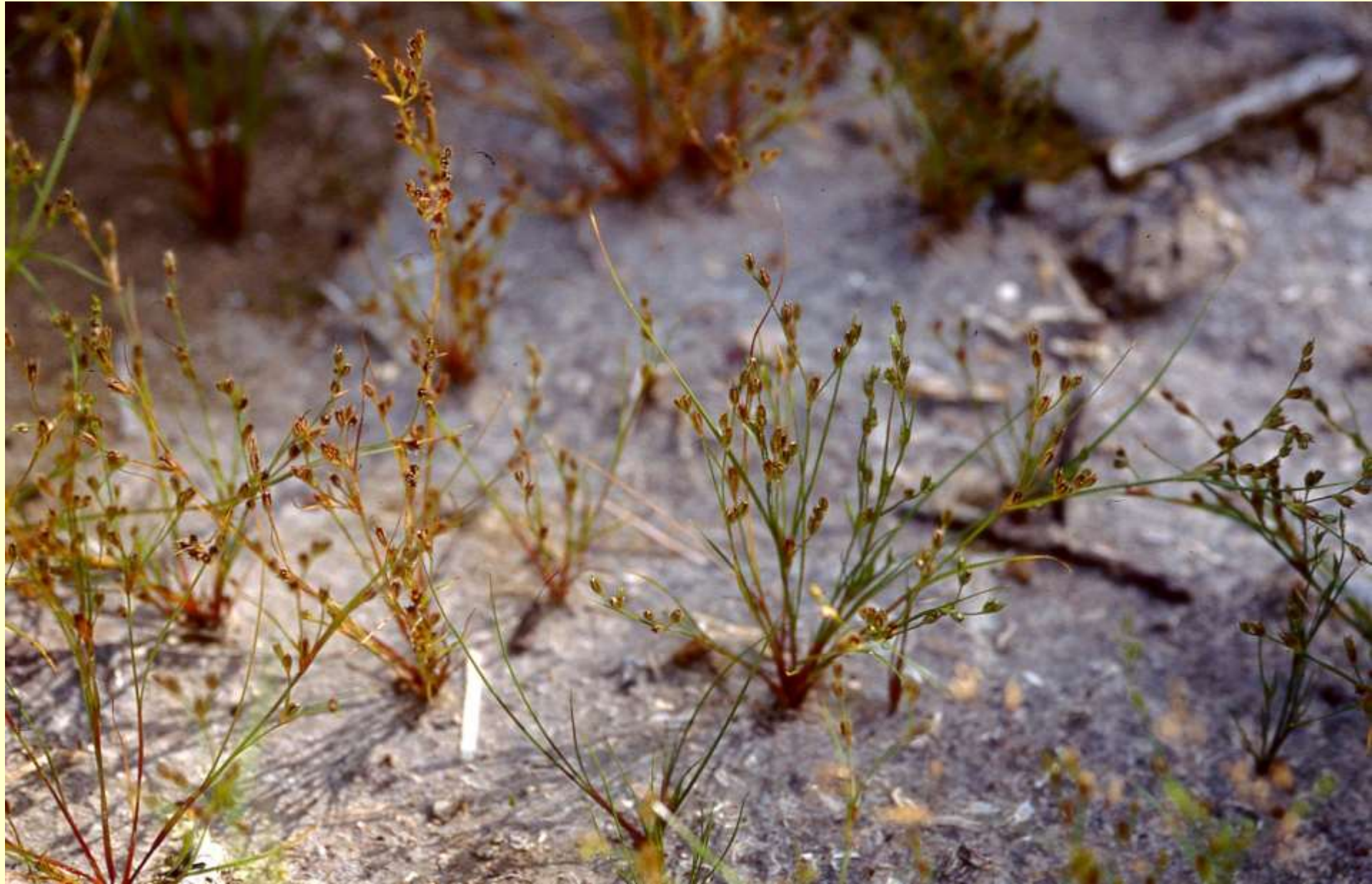
Vägtåg, Juncus bufonius