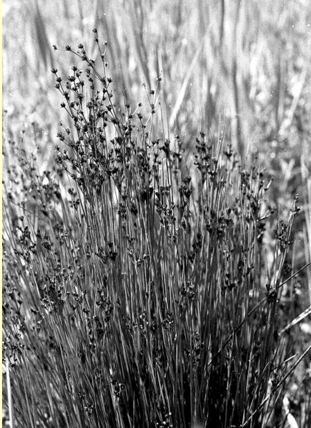
Ryltåg, Juncus articulatus