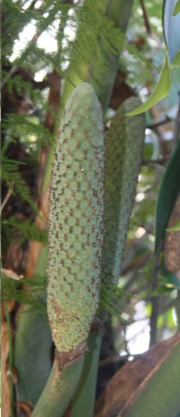
Fredskalla ( Spathiphyllum )