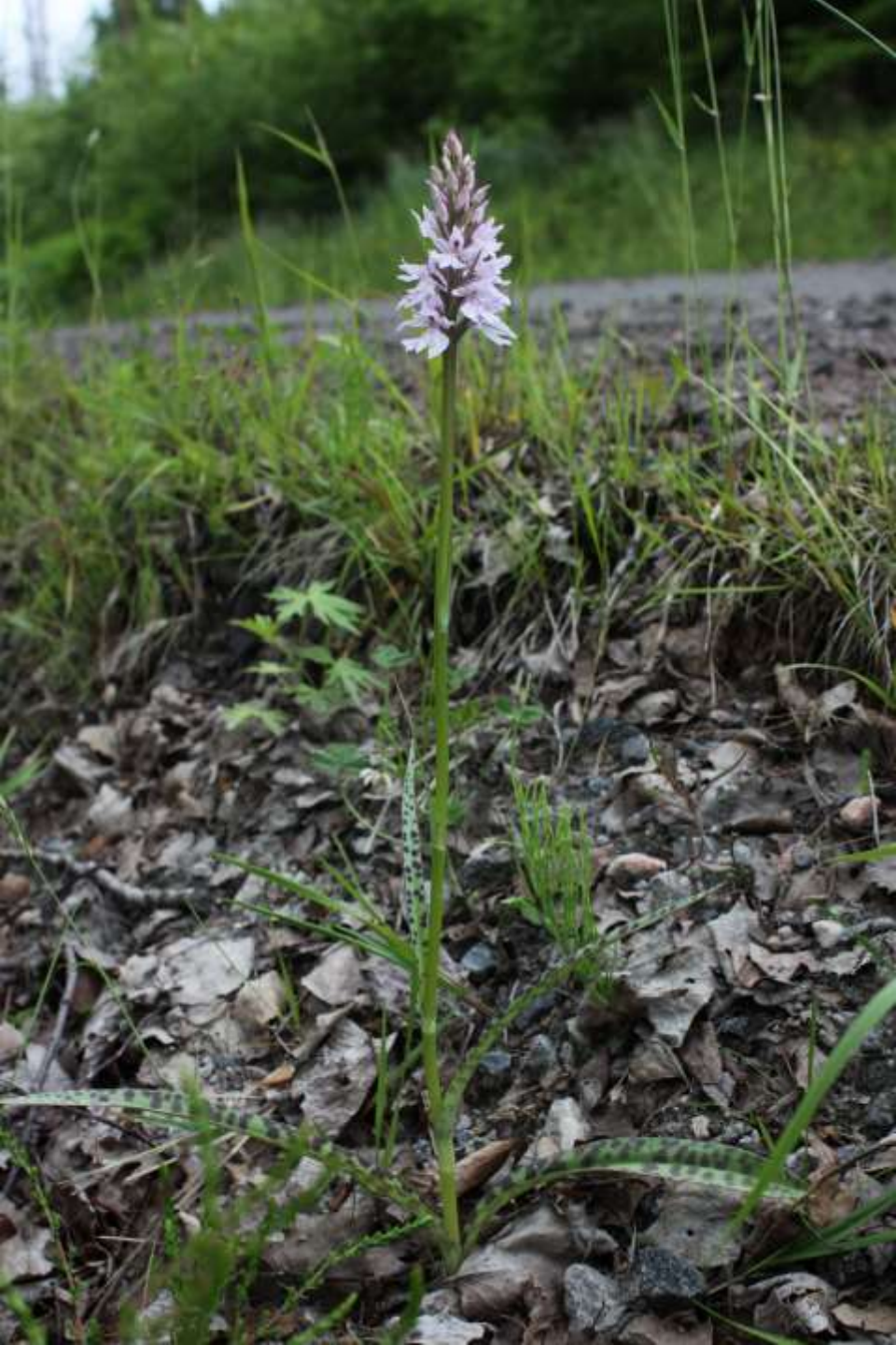
Jungfru Marie nycklar