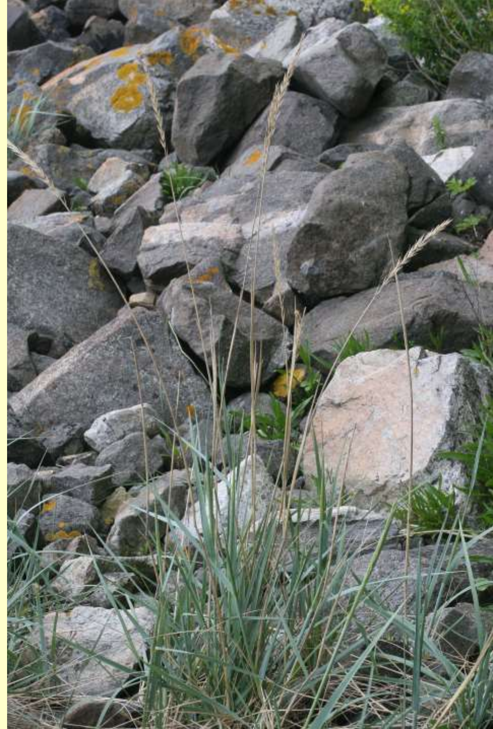
Strandråg, Leymus arenarius