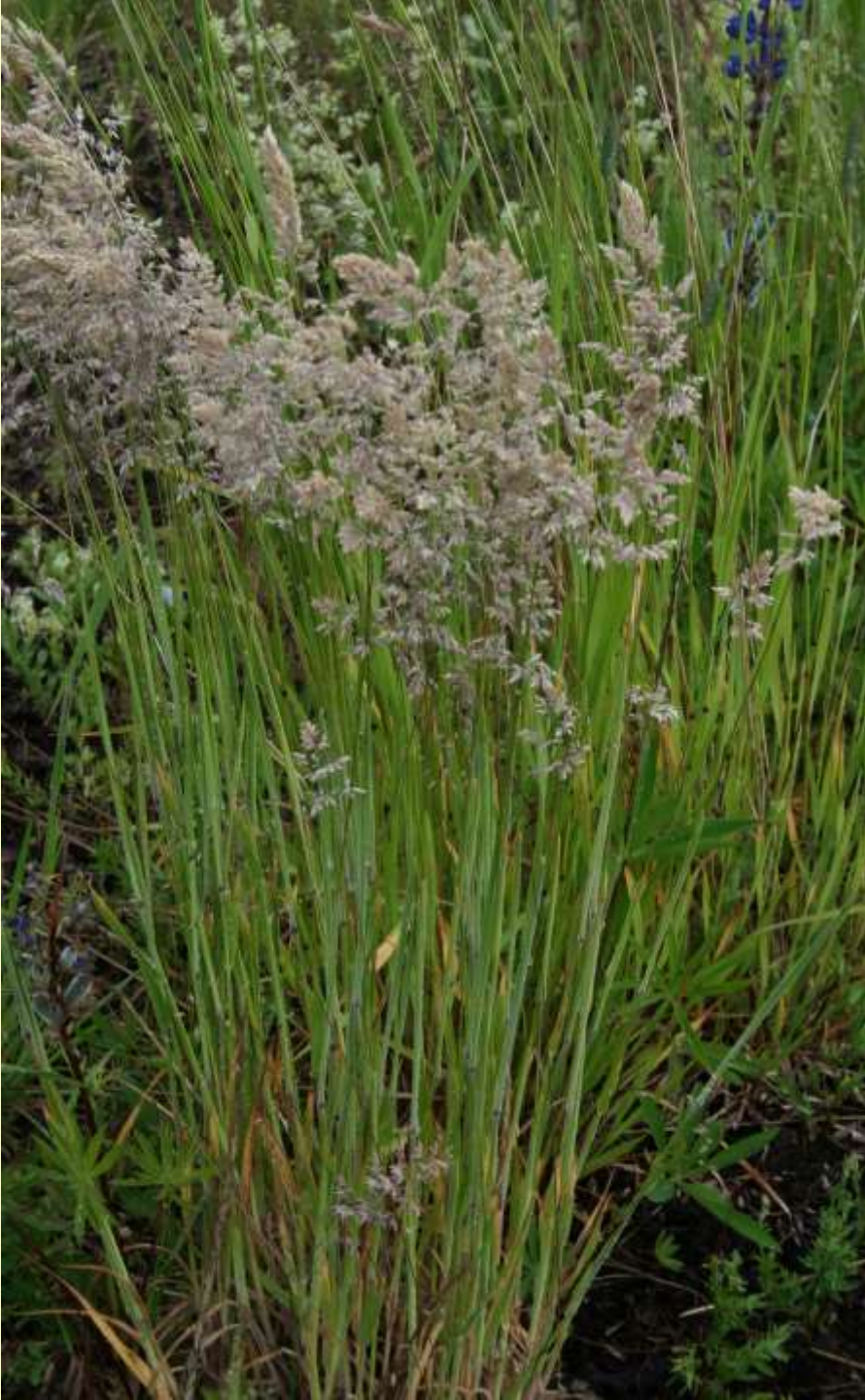
Luddtåtel, Holcus lanatus