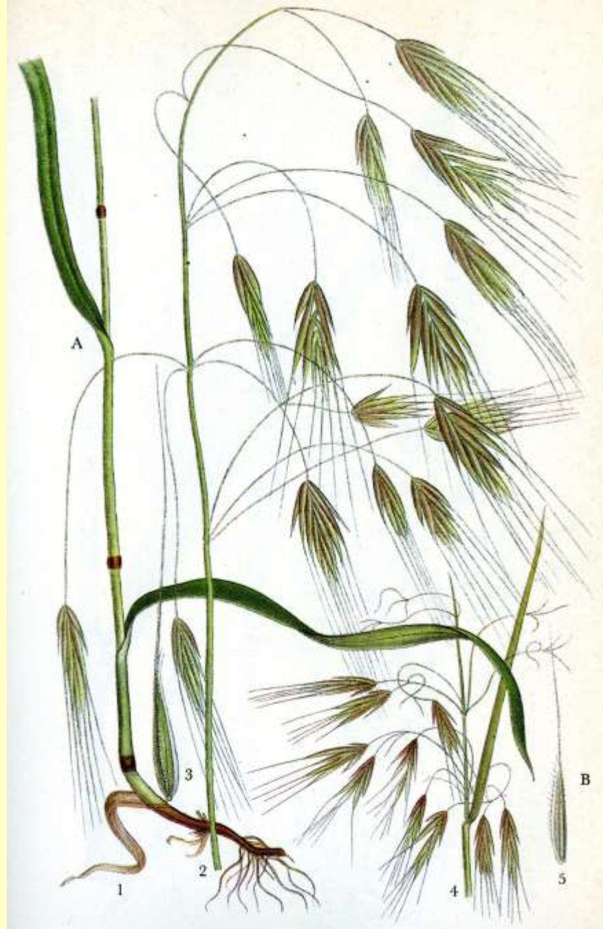
107 A. SANDLOSTA, BROMUS STERILIS L. B. TAKLOSTA, BROMUS TECTORUM L.