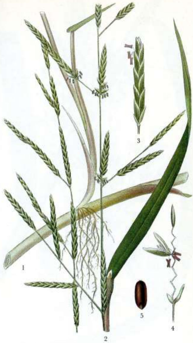
71. MANNAGRÄS, GLYCERIA FLUITANS (L.) R. Br.

Högt vattenlevande gräs med småaxen parallella med grenarna