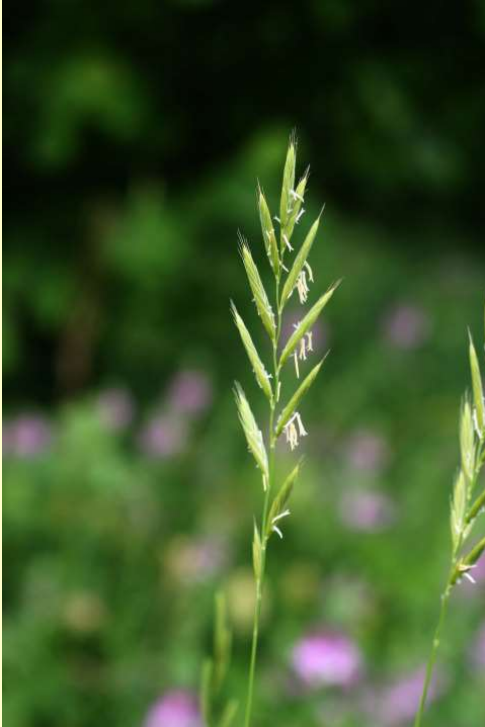
Backskafting, Brachypodium pinnatum