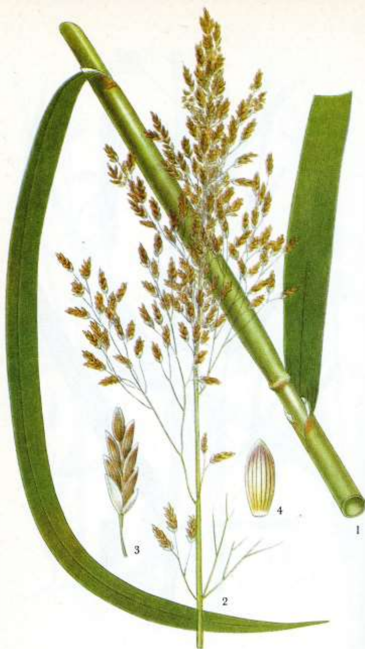
72. JÄTTEGRÖE, GLYCERIA MAXIMA (Hartm.) Holmb.