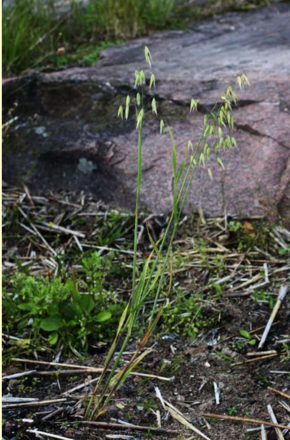
Havre, Avena sativa