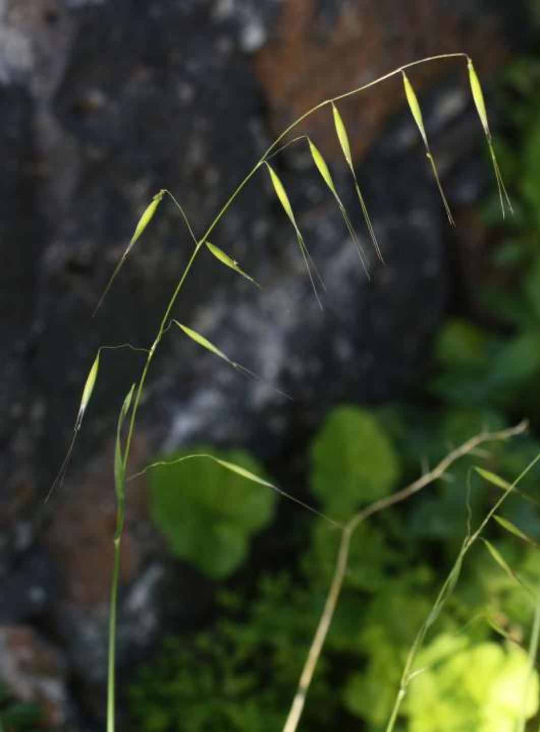
Flyghavre, Avena fatua