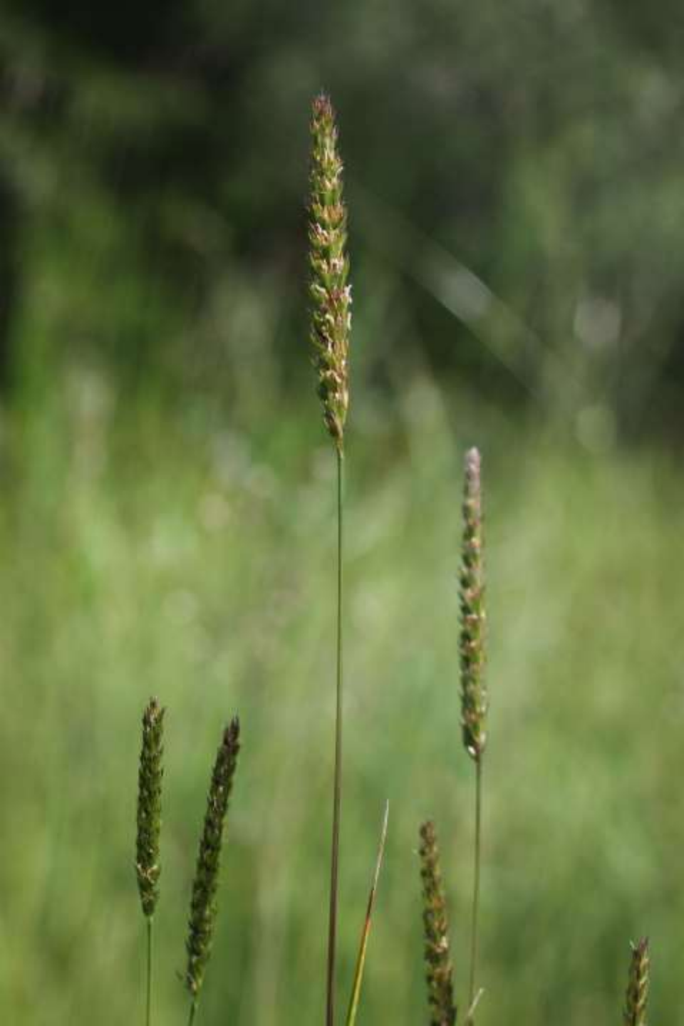
Kamäxing, Cynosurus cristatus